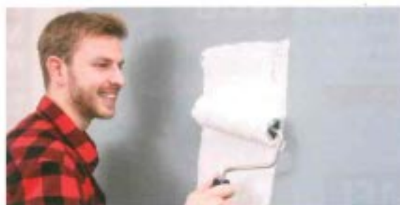
Das neue Bindemittel ist für schwierige Untergründe wie etwa Latexanstriche geeignet.

Eigenschaften wie die Emissionsfreiheit nach AgBB (bewertet vom Ausschuss zur gesundheitlichen Bewertung von Bauprodukten) bestätigen die Qualität der Anstrichstoffe. Zudem ist das Bindemittel sehr flexibel, da die Beschichtung auf Untergründen nicht versprödet. Replebin ist vom Institut Fresenius, dem TÜV Rheinland und dem Bremer Umweltinstitut geprüft. Die biogene Qualität ist bestätigt. Auch wurde das selbst entwickelte Bindemittel durch das Bundesministerium für Wirtschaft und Energie gefördert.